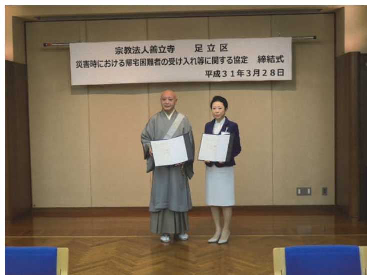
図1 平成 31 年 3 月 28 日に行われた善立寺と足立区の協定式

宗教施設が正式に避難所として認められるには、各宗教法人と基礎自治体との間で協定を結ぶ必要があります。実際には足立区と善立寺や杉並区と立正佼成会などいくつかの宗教法人が協定を結んでおり、帰宅困難者の一時受け入れ施設となっています。調査では 49%の宗教施設が協力の意向を示しており、また東京都からも基礎自治体へ仲介を促しましたが、なかなか協定締結までには至っていません。これにはいくつかの原因があります。ひとつは基礎自治体の人員の問題です。各