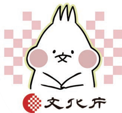
文化庁広報誌ぶんかるキャラクター 「ぶんちゃん」