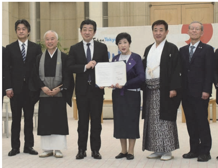
図 2 令和 7 年 4 月 28 日に東京都庁で行われた協定式

本協定は東京の防災力向上を図るため、発災時に東京都と東京都宗教連盟が相互に連携・協力する上での基本的事項について定めることを目的としております。その上で相互に情報交換を密にして防災に関する連絡会を活用した情報共有等を行っていくことが取り決められました。この目的を果たしていくために、発災時に防災協力が可能な加盟団体施設（東京都宗教連盟に加盟する各宗教団体の施設をいう。）を把握し、具体的に以下の 4 つの項目について東京都と情報共有を図ることになりました。